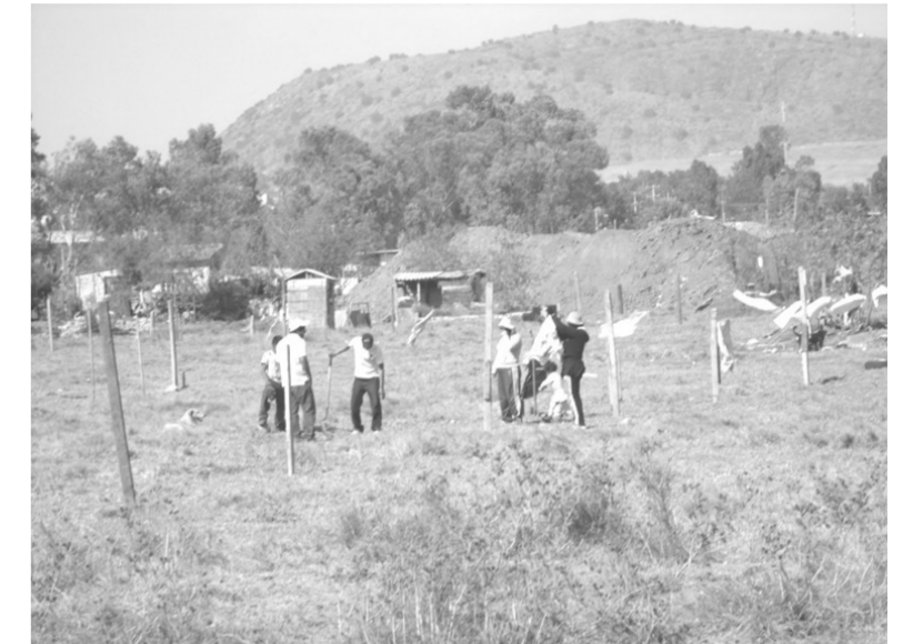
En pleno la invasión del terreno de las tablas.

Sin embargo, se debe reconocer la buena voluntad del alcalde en turno, quien busca servir a la comunidad como lo prometió en campaña sobre todo, cambiando la mala imagen que por varios trienios ha conservado este tan golpeado municipio.