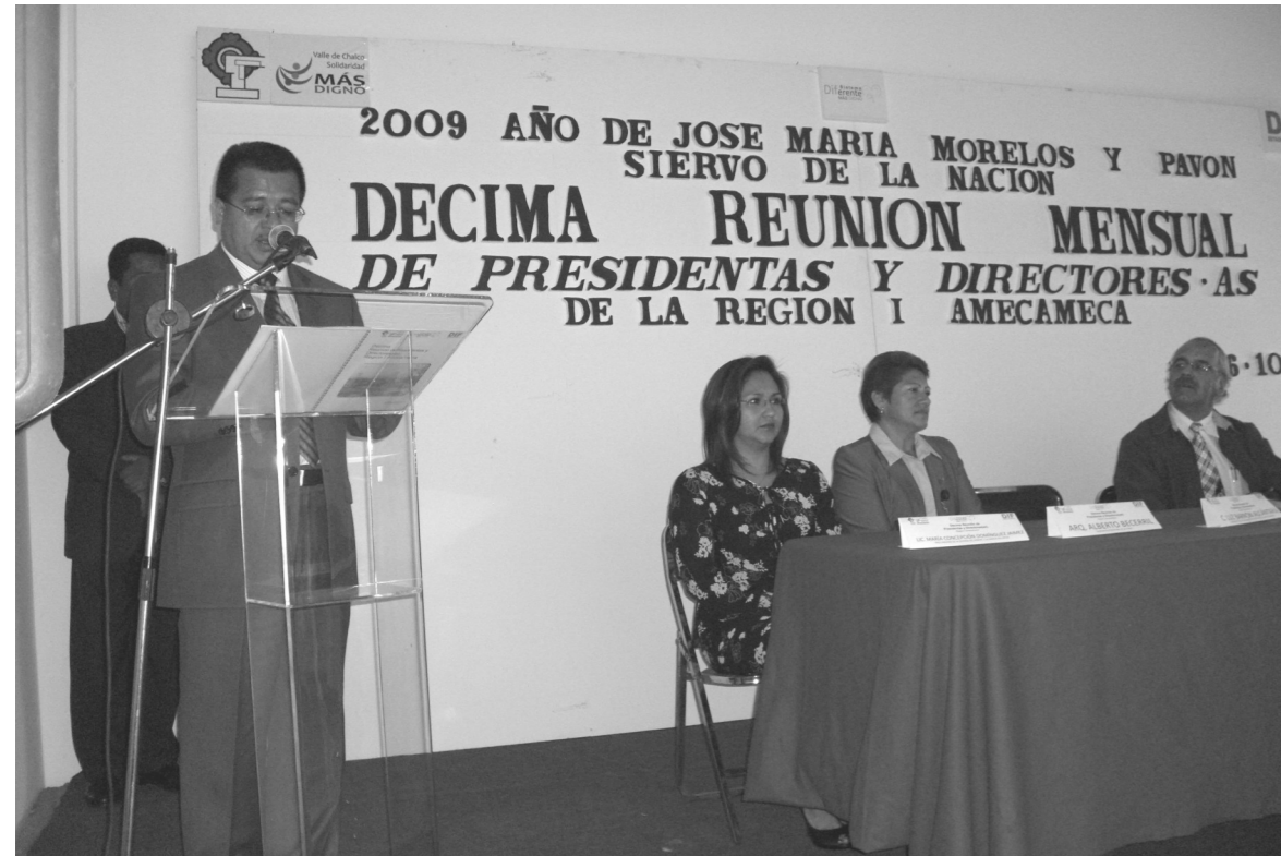
Valle de Chalco Solidari-

dad, Méx.- Con la seriedad que se requiere en este tipo de eventos, se llevó a cabo la Décima Reunión de Presidentas y Directores de los Subsistemas para el Desarrollo Integral de la Familia DIF de la Región 1 Amecameca, siendo la sede este municipio de gran importancia donde se dio a conocer los programas que realiza el DIFEM en beneficio de las personas más desprotegidas de la sociedad.