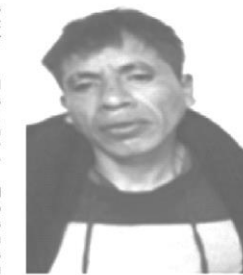
delito de robo a local comercial con violencia. Concluyó que la seguridad se refuerza periódicamente en todos los rubros para que los ciudadanos puedan ejercer sus actividades comerciales con la confianza del municipio.