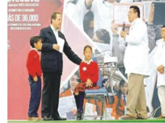
Universidad Politécnica de la Zona Oriente del Estado de México, que ofrecerá 800 espacios para jóvenes de la región.

En la Unidad Deportiva Silverio Pérez, otorgó tarjetas La Efectiva con 2 mil 500 pesos por ciclo escolar, para los integrantes de escoltas, kits deportivos, becas a estudiantes de excelencia, equipos de cómputo en favor de niños con alguna, además de dar a conocer que se construirá la