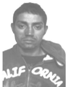
Nezahualcóyotl, Méx. - Elementos del Grupo Especial Coyotes detuvieron a tres sujetos pertenecientes a una banda dedicada al robo de locales comerciales, lo anterior, después de acudir