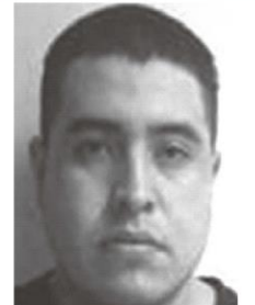
Los Reyes la Paz, Méx.- Tres sujetos fueron detenidos por elementos de la Dirección General de Combate al Robo de Vehículos y Transporte (DGGCRVYT), de la Comisión Estatal de Seguridad Ciudadana (CESC), luego de que varios pasajeros los señalaran como responsables de despojarlos de sus pertenencias en un camión de servicio público. Elementos de la Policía Estatal que