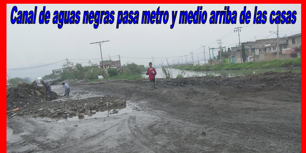
Canal de aguas negras pasa metro y medio arriba de las casas