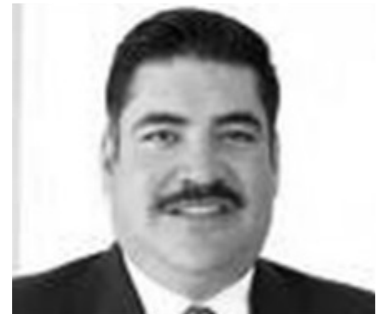
El Alcalde de Xonacatlan Ramón Saavedra Gutiérrez, es exhibido por sus gobernados, como una autoridad deshonesto.

Son graves los señalamientos que hacen los pobladores de este municipio contra su Alcalde Ramón Saavedra Gutiérrez, ya que entre sus caprichos está la compra de