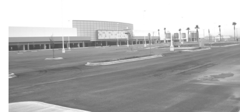
Majestuosa la construcción de Soriana a través de presuntas negociaciones turbias con el Presidente Municipal.

Por otra parte, es de suma importancia investigar quien gestionó las licencias de construcción de ese asentamiento habitacional donde las humil-