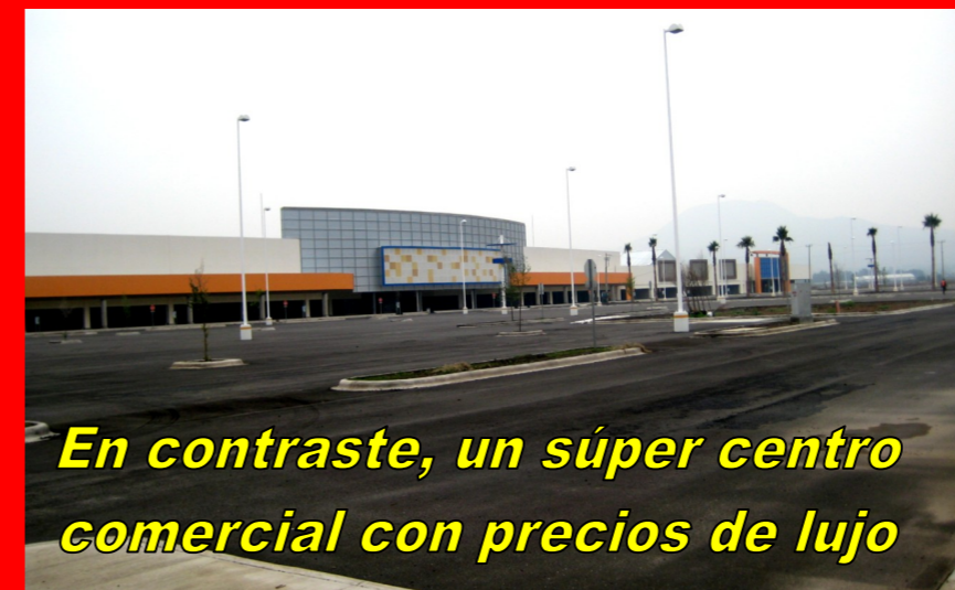
En contraste, un súper centro comercial con precios de lujo