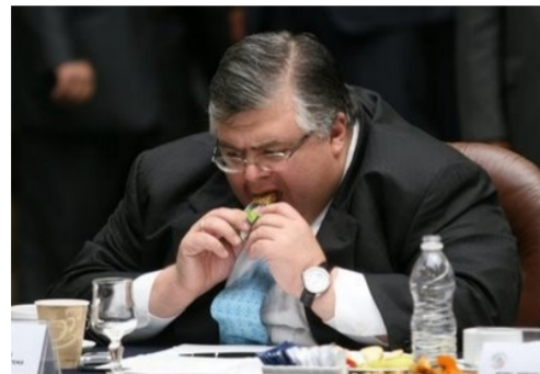
PESA 174 KGS. Y VEA LO QUE NOS CUESTA:

El ex Secretario de Hacienda y ahora Gobernador del Banco de México, Agustín Carstens es Licenciado en Economía por el Instituto Tecnológico Autónomo de México (ITAM)