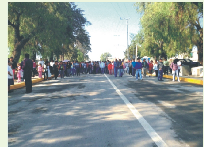
cancha y del deportivo y la trota pista en el perímetro de la cancha de fútbol donde se invirtieron más de 3 millones 600 mil pesos.

En esta obra se destaca el apoyo al rubro deportivo, ya que lo realizado en la unidad deportiva consta de; construcción de baños y vestidores, gradas de estructura metálica con cubierta techada, construcción de red de agua tratada y sistema con sistema de riego para la cancha con esta misma agua tratada. La conformación del campo de fútbol, el enmallado de perímetro de la