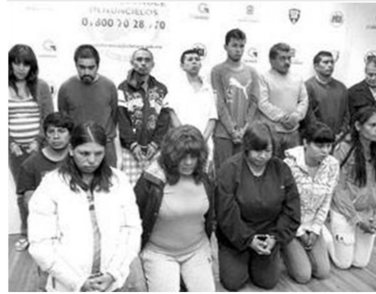
"Los Talibanes" dedicados al secuestro, crímenes y extorsiones en territorio mexiquense.

Por Ricardo Ramírez Toluca, Méx.- En una acción coordinada entre elementos de la Policía Ministerial y uniformados de la Secretaría de Seguridad Ciudadana, se inició la limpia del territorio mexiquense, al ser asegurados 16 delincuentes de la peor calaña, dedicados al secuestro, levantones y crímenes.