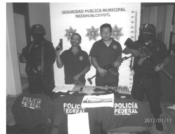
Estos son los delincuentes dedicados al robo de casas habitación y secuestros, quienes presuntamente pertenecen a la "familia michoacana".

de los dos sicarios de la "familia michoacana" que fueron detenidos en las afueras de Ciudad Jardín, quienes vestían ropa con las siglas de la PGR, sin serlo y que en su vehículo Sentra con matrícula 611-SUF, portaban un rifle AK-47 chalecos contra balas, uniformes de la Policía Federal, una serie de mensajes dirigidos a diferentes comerciantes e industriales firmados por la "familia tarasca", además de un folder con la información completa de un funcionario de Coacalco a quien pretendían secuestrar, estos ya están en manos de autoridades mayores.