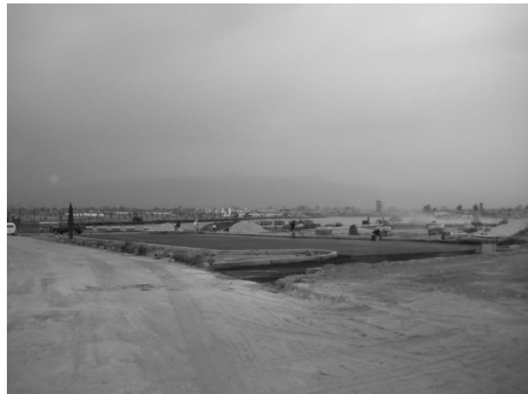
La finalidad es tapparla para realizar un fraccionamiento.