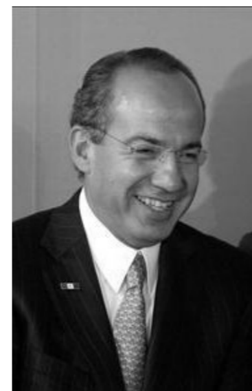
Por Isaías Aguilar R.

Nezahualcóyotl, Méx.- El ataque sistemático que grandes políticos de la oposición han estado realizando a través de la radio y redes sociales en relación con los errores del ex Gobernador Enrique Peña Nieto, no cumple con sus objetivos, ya que la mayoría de mexiquenses no comparte esas críticas por que conocen el trabajo que hizo durante seis años en el Estado de México. La encuesta llevada a cabo por este medio informativo, arrojó que la gran mayoría de gente no le interesa que el próximo