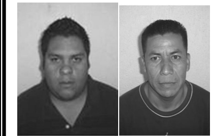
Por robo de vehículos fueron asegurados por elementos de la ASE y puestos a disposición de la ley.

Los detenidos pertenecen a una bien organizada banda de delincuentes que operan sobre la carretera Federal México Texcoco, estos fueron puestos a disposición del agente del Ministerio Público acantonado en el centro de justicia del municipio de Los Reyes La Paz.