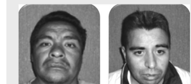
Estos son los dos padrotes dedicados a explotar a menores de edad a quienes obligaban a prostituirse en el bar Tropicana.

Nezahualcóyotl, Méx.- Por los delitos de privación ilegal y prostitución a una menor de edad, fueron asegurados por