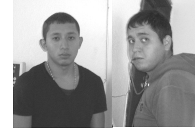
Dos jóvenes pertenecientes a la Familia Michoacana uno de 17 años y el segundo de 24, fueron detenidos.

Los hechos se registraron cuando el autobús de pasajeros con número de matrícula 248NZ058, circulaba por la avenida Bordo de Xochiaca y los integrantes del auto Astra con placas 248-WYG se les emparejó y buscaban que el conductor detuviera la unidad para asaltar a los pasajeros y dejarle una cartulina color verde con la leyenda,