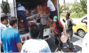
En la presente grafica se puede observar cómo se descargan los camiones de la empresa GRAVITAMX, en las oficinas de la fundación México Unido, donde se entregó y se entregaran constantemente este tipo de ayuda a la gente que menos tiene.