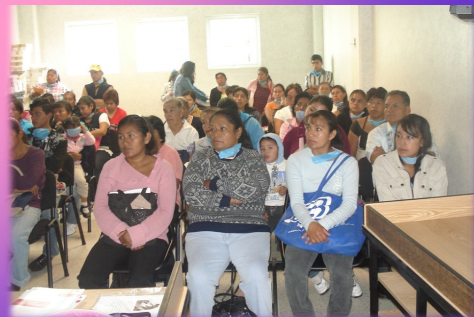
Numeroso grupo de amas de casa acudieron a la Conferencia de la Fundación "Empecemos hoy el Futuro del Mañana", llevado a cabo en el Centro Médico de la Col. Magdalena Atlipac, Los Reyes, La Paz.