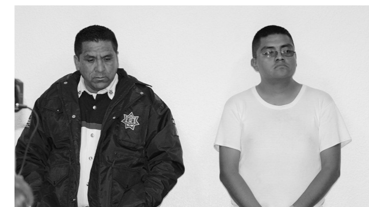
Estos son dos de los cuatro delincuentes quienes perteneciendo a la Policía Municipal se dedicaban al robo con arma de fuego.

Pero al llegar como Director de esta corporación Víctor Alejo Muños, por su incapacidad permitió que la delincuencia organizada penetrara a la corporación y en otro de los casos, los uniformados se amañaron y por las noches se hacían acompañar con delincuentes quienes junto con estos, vestían uniformes negros, se colocaban pasamontañas, cubrían los números de las patrullas y se dedicaban al asalto. Esto se demostró al ser deteni-