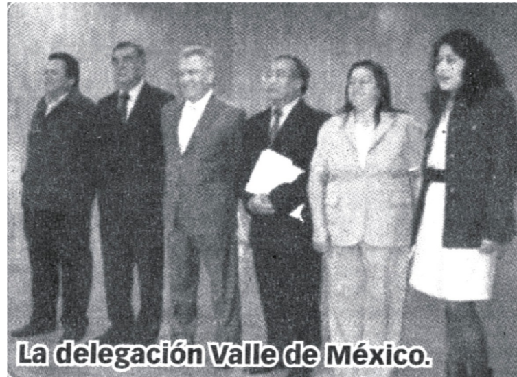
La delegación Valle de México.