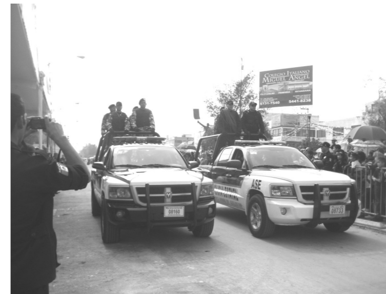
Patrullas de la Policía Municipal y Estatal, recorriendo las calles de Nezahualcóyotl, para brindarle seguridad a la Población.

o de lo contrario presentarlo ante el agente del Ministerio Público, ¿de cuanto es la extorsión? Bueno según el sapo es la pedrada.