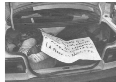
Esto es lo que las autoridades contemplaron dentro del auto Tsuru, cuatro hombres y una mujer, con las manos y pies sujetos con cinta canela y la cara cubiertos con esta misma, además del tiro de gracia.

Vecinos de la colonia Santa Clara Cuauhtitla, se percataron que del auto con placas 35-33- JEK que se encontraba estacionado en la calle Santa Clara y la Vía Morelos, escurrió sangre, por lo que dieron parte a las autoridades competentes. Elementos de la Policía Municipal solicitaron la intervención de la Fiscalía Especializada en Homicidios, quie-