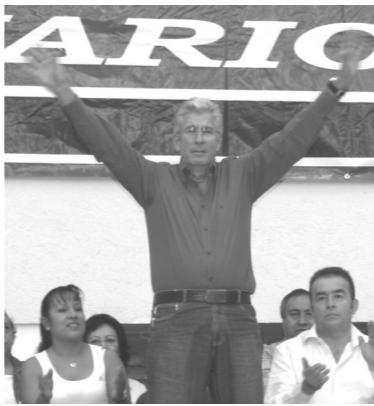
Gerardo Ruiz Esparza, Secretario de Comunicaciones y Transporte, en representación del Gobernador Enrique Peña, Fue el encargado de dar la patada de inicio al torneo infantil.