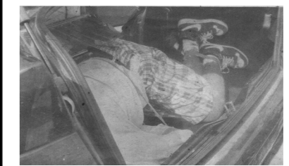
De cuatro balazos sus victimarios privaron de la vida al santero, la Policía Ministerial ya investiga este crimen.

CHIMALHUACÁN, Méx.-Del interior del vehículo Derby que se encontraba estacionado en la colonia Villas de San Lorenzo, salía un olor nauseabundo por lo que se le dio parte a las autoridades competentes, quienes para evitar que los fotógrafos de los medios de comunicación sacaran sus placas, el vehículo fue trasladado al Centro de Justicia y al abrir la cajuela, se percataron que en su interior se encontraba el cuerpo sin vida de un hombre, quien fue ultimado de cuatro balazos en la cabeza.