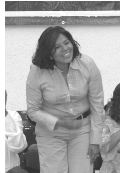
María José Alcalá, Diputada Federal, Con gran entusiasmo organizó este torneo que sin lugar a dudas motivará a todos los pequeños futbolistas que en un futuro recordarán estos bellos momentos.

patada inaugural para dar inicio al mencionado torneo no sin antes escuchar las voces de los invitados especiales mismos que coincidieron en que este tipo de motivaciones son y serán fundamentales en la formación de los jóvenes en el