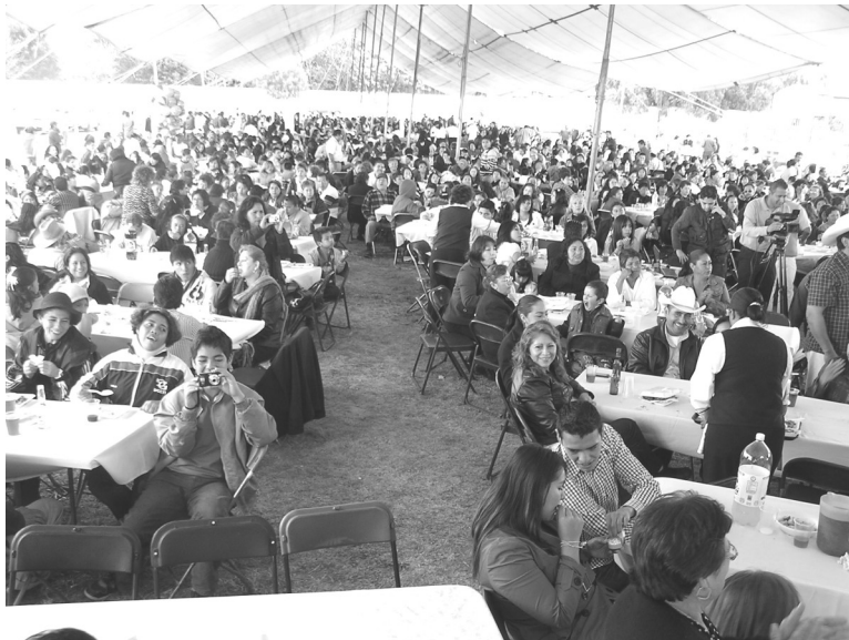
Líderes, servidores públicos y amigos del diputado Armando Corona estuvieron presentes para agasarlo.

actual diputado Federal Armando Corona Rivera, donde la gente reunida le mostró cariño y agradecimiento por haber realizado como Alcalde obra de beneficio social buscando el mejoramiento de la población. Cabe señalar que al término de su mandato busco la diputa-