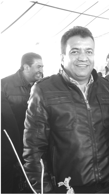
También asistió a la celebración el diputado federal, Omar Rodríguez Cisneros.

El legislador abundó en el tema comentando que se obtuvieron recursos de apoyo para el campo, así como para la gente que quedo desprotegida ante la embestida que ocasionaron fenómenos naturales, de igual forma se concretaron acciones en obras como la Unidad Deportiva de Río Frío y otra en la colonia Ampliación San Francisco, entre otras.