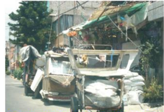
Calle Tlalpan No. 230 Col. Vicente Villada, Además de la deplorable imagen pública que esto representa, los vecinos tienen que bajar el carro vehicular con el peligro de ser atropellados.

aviadores. Reporteros de este medio informativo seguirán recorriendo las calles de este municipio para tomar gráficas de estos abusos, dando domicilios exactos de su ubicación para que no se tenga pretexto de que no saben en qué lugar se encuentran los obstáculos que impiden el libre tránsito de la gente.