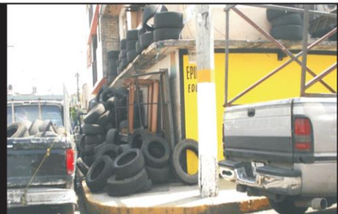
Calle Cielito Lindo esquina con calle Fardito de la Col. Benito Juárez. Llantas y más llantas invadiendo las banquetas en ocasiones abarcan toda la manzana aseguran vecinos.