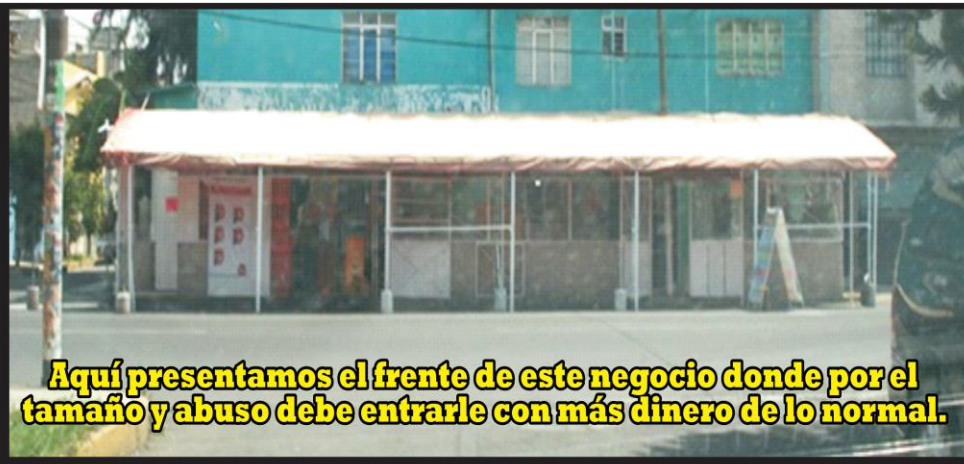
Aquí presentamos el frente de este negocio donde por el tamaño y abuso debe entrarle con más dinero de lo normal.