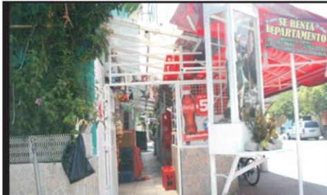
Este es el otro lado de la tienda donde se perciben jardineras, puerta y mercancía, hasta el altar de un santo por las dudas.