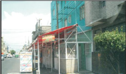
Av. Pirules entre calle Hidaigo y calle Aliende Col. Las Fuentes Gran negocio donde enrejaron totalmente además de las jardineras. Colocaron puertas de metal por ambos lados y por la noche cierran impidiendo el paso en su totalidad hasta se dan el lujo de dejar mercancía día y noche.