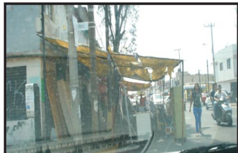
Negocio de venta de muebles usados Av. Pirules esquina calle Cuauhtémoc Col. Las Fuentes En esta gráfica se puede observar cómo la gente camina por el arroyo vehicular con sus respectivos riesgos.

VISITA NUESTRA PAGINA : pulsometropolitano9.wix.com/periodico