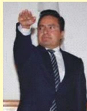
el ejercicio presupuestal en masa.

Lo cierto es que el denominado “supersecretario” tendrá a su cargo todo lo relativo a las obras de gran impacto en materia de infraestructura y por ende quedarán bajo su resguardo los miles de millones de pesos que se sean asignados a las carreteras, autopistas, hospitales, parques y todo aquello que amerite