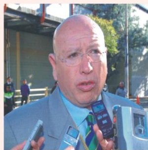
Por Ricardo Ramirez.

mejorar el transporte en el Estado de México. Algunos de los legisladores locales pedían la comparecencia de Isidro pastor al recinto legislativo para que presentara su renuncia por no terminar con las altas tarifas de las grúas y los corralones, así como el desmantelamiento de las unidades que metían a los corralones y sobre todo, los elevados pagos por su liberación, sin embargo todo esto ya se terminó.