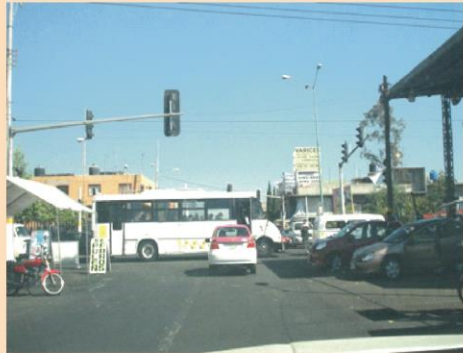
Por Víctor Hernández.

Nezahualcóyotl, Méx. - La mayoría de semáforos de Ciudad Nezahualcóyotl se encuentran en total abandono, por lo que diariamente se genera además de serios congestionamientos vehiculares, constantes choques, mismos que dan pauta para que los uniformados abusen de los conductores que en su mayoría no cuentan con un seguro de auto. Este municipio carece de muchos otros servicios a pesar de las declaraciones que emite el Alcalde, pero esto de abandonar el mantenimiento a los semáforos no es nuevo, desgraciadamente ha sido un problema de muchos años, sin embargo con el aumento de vehículos que se desplazan en la localidad ya debieran hacer algo al respecto. Si su mantenimiento resulta