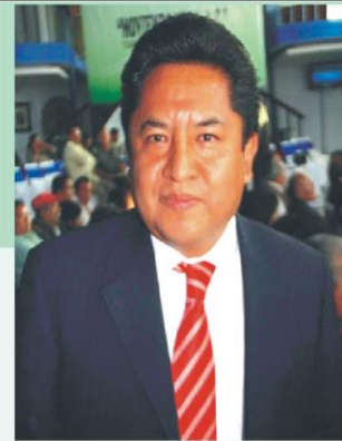
Por: Jaime Miranda