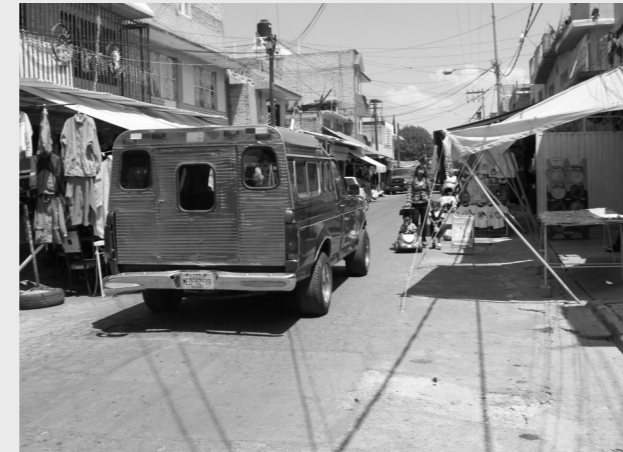
Esta grafica muestra el peligro que corren las personas, niños y bebés en carreolas, por la irresponsabilidad de las autoridades municipales.

esto no le interesa al responsable de Vía Pública por que presuntamente recibe fuertes cantidades de dinero por permitir de forma irresponsable este tipo de acciones.