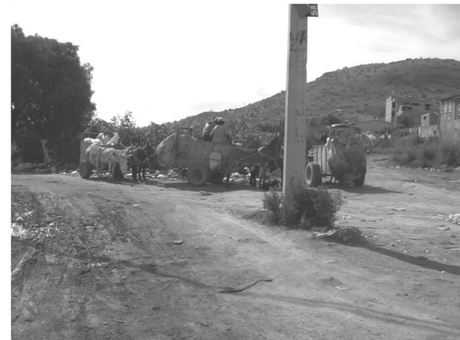
Esta foto es elocuente en cuanto a que se sigue depositando basura en el tiradero de San Sebastián.

argumentan molestos que esta visto que son más importantes los jugosos negocios que representan grandes cantidades de dinero a servidores públicos que el descontento de los ciudadanos que tienen la necesidad de vivir con el temor de ser infectados por tanta quiería que se deposita en este lugar.